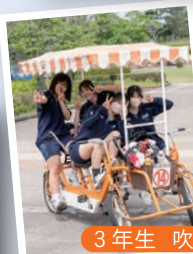
3年生 吹上浜海浜公園