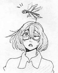
イラスト マルチメディア科2年女子 資格試験情報

来月(11月25日)には、本校で「青少年赤十字研究推進研究発表会」が行われる。日常の活動として、多くの部活動や学科で様々な活動が行われている。学校現場の中で、「気づき・考え・実行する」という態度目標をいかに具現化しているのかを発表されるのかとても楽しみである。