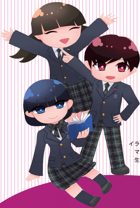
イラスト マルチメディア科 生徒作品