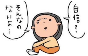
■私は、自分自身に満足している

下のグラフは 内閣府の「我が国と諸外国の若者の意識に関する調査」結果です。 (平成25年度実施、調査対象13~29歳) 他国に比べて日本の若者は「 ネガティブな意識が強い 」傾向となっています。