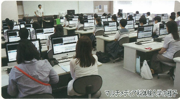
マルチメディア科体験入学の様子

7月26日(火)、27日(水)、28日(木)、30日(土)の4日間、夏の一日体験学習が行われました。本校9学科の学習体験や多くの部活動の体験に、中学生の皆さんが熱心に取り組みました。保護者の皆さんも多く参加されました。